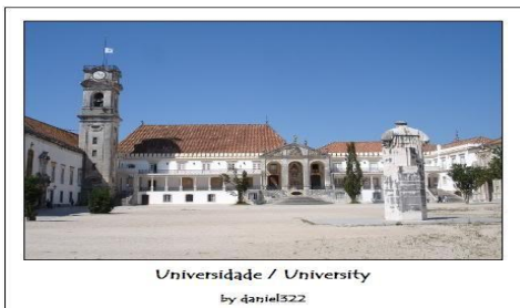
Universidade / University by daniel322

01.06 – Café da manhã. Início da viagem de regresso à Portugal, passando pela cidade de Valença. Almoço , onde poderemos saborear o famoso “Leitão na Bairrada”. Visita a cidade de Coimbra, antiga capital do país e Cidade Universitária. Visita a Universidade, com a sua antiga biblioteca do Séc. XVIII, a mais antiga e importante do país e a capela de São Miguel. Acomodação em hotel em Coimbra.