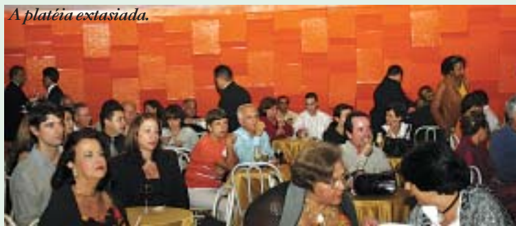
A platéia extasiada.

Após as homenagens iniciais, foram entregues os prêmios aos participantes e, em seguida, foi servido um deliciosíssimo coquetel. Na oportunidade, os presentes puderam apreciar a excelência do Quarteto de Cordas de Brasília, especialmente contratado para o evento. Estão de parabéns os que prestigiaram o evento, lotando a boate da ASBAC, pois quem não foi PERDEU!