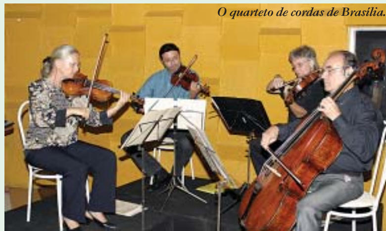
O quarteto de cordas de Brasília.

Após as homenagens iniciais, foram entregues os prêmios aos participantes e, em seguida, foi servido um deliciosíssimo coquetel. Na oportunidade, os presentes puderam apreciar a excelência do Quarteto de Cordas de Brasília, especialmente contratado para o evento. Estão de parabéns os que prestigiaram o evento, lotando a boate da ASBAC, pois quem não foi PERDEU!